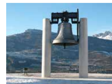
Fondazione Opera Campana dei Caduti - Rovereto (Tn)

Dal 2010 HUMAN RIGHTS? ha ottenuto ogni anno il patrocinio del Consiglio d’Europa e nel 2013 il patrocinio della Presidenza della Camera dei Deputati e del Ministero dei Beni e delle Attività Culturali. In tutte le altre edizioni sono stati concessi patrocini da istituzioni ufficiali, quali la Commissione Italiana per l’UNESCO.