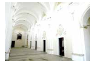
Ex Convento dei Francescani Neri - Specchia (Le)