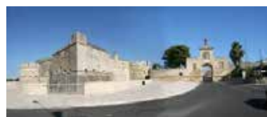
Castello di Acaya - Lecce