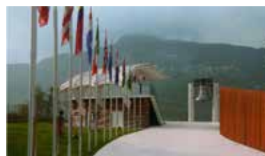
Fondazione Opera Campana dei Caduti - Rovereto (Tn)