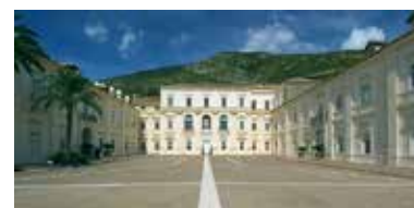
Real Sito Belvedere di San Leucio - Caserta